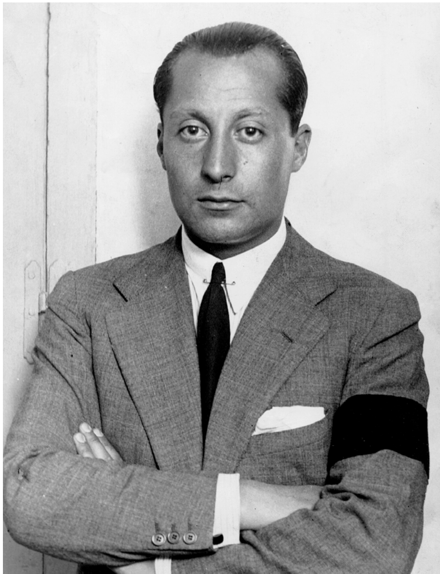
Primo de Rivera creà el 1933 Falange Española. Avui sis grups falangistes diferents es disputen el seu llegat ideològic.

Falange Española-La Falange (FE-La Falange) va nàixer el 1999 com a escissió de Falange Española de las JONS. Comandat per Jesús López, el grup inicial assumí tot d'una les característiques ideològiques i polítiques dels moviments neonazis europeus als quals es vol homologar. Sota el posterior liderat de José Fernando Cantalapiedra ha intensificat l'aposta política d'extrema dreta. Dos eixos essencials vertebraren el seu discurs. Primer, el rebuig a la “massiva immigració” i, segon, la defensa de la “unitat nacional” contra “les autonomies que han portat el país a una situació insostenible socialment, moralment i econòmicament”. El grup publica a in- →