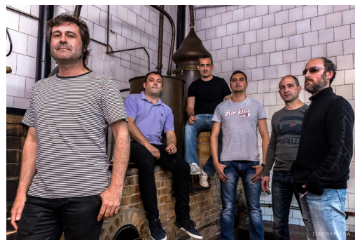
La banda de Puçol, Mox, hereva del concepte de la fusió de la música d'arrels amb el rock d'inspiració indie .

Al marge de la considerable relació de Los Planetas amb festivals, segells i mitjans de comunicació del nostre àmbit, els de Granada tenen una sòlida base de seguidors als Països Catalans. I es pot dir també que la seua influència artística es pot rastrejar no sols en l'escena independent cantada en castellà sinó també en la que fa servir el català com a vehicle d'expressió. Al País Valencià, El corredor polonès inclogué una versió de Los Planetas, "Desaparèixer", en el seu disc de comiat, Fenòmens tangibles (2014). I també és evident la influència (o almenys les influències compartides amb Los Planetas) de la banda de la Marina Mox Nox. En tot cas, la petjada més evident cal buscar-la a Puçol (Horta Nord): el tret distintiu de Mox (no confongueu amb Mox Nox) és la fusió de la música d'arrels valenciana amb el rock indie , directament inspirada pel disc La leyenda del tiempo . Un disc que,