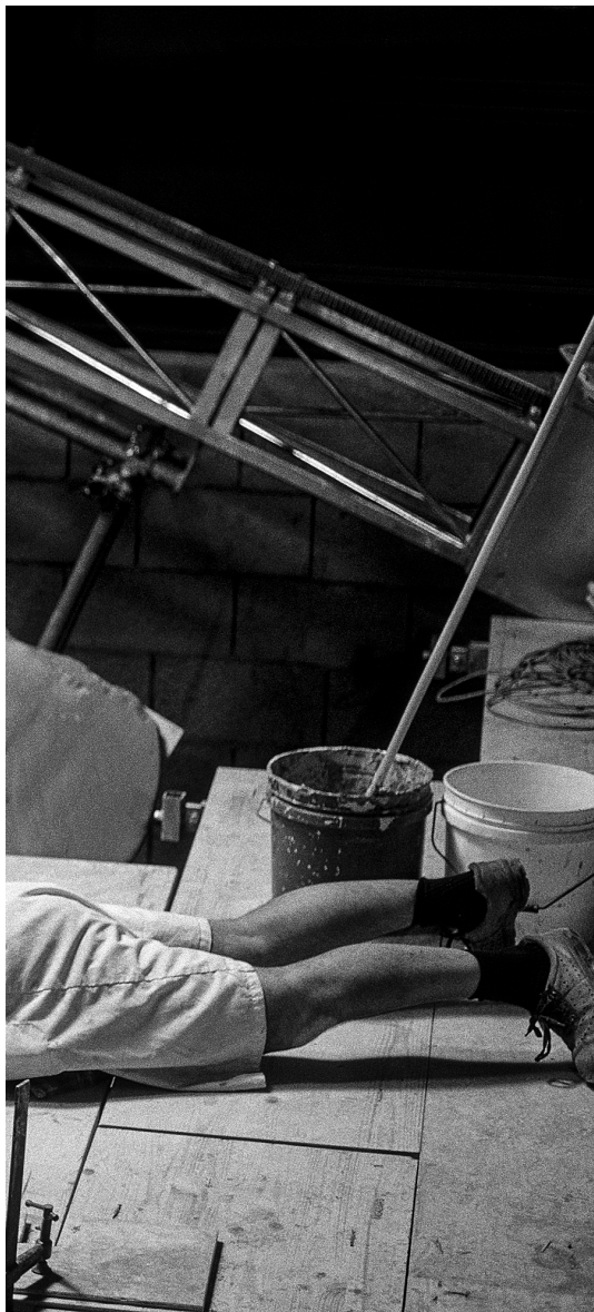
LA CAPELLA DEL SANTÍSSIM DE LA SEU. L'art de Miquel Barceló s'observa en nombrosos detalls, com ara la tècnica de la grisalla o el miracle bíblic de la multiplicació dels pans i els peixos, ambdós mostrats a la pàgina 57.

parlar del projecte. El cost estipulat ja hi apareixia en euros: 3 milions i mig.