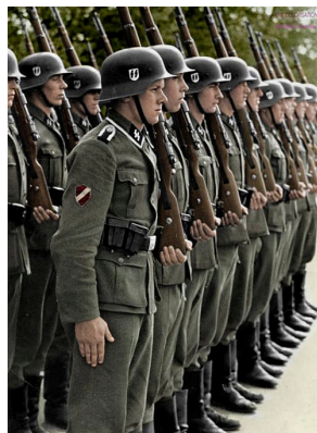
Imatges històriques de la Legió Letona desfilar pels carrers de Riga. Els seus efectius portaven l'uniforme estàndard de les Waffen-SS amb el distintiu nacional corresponent, que llueix la bandera letona.