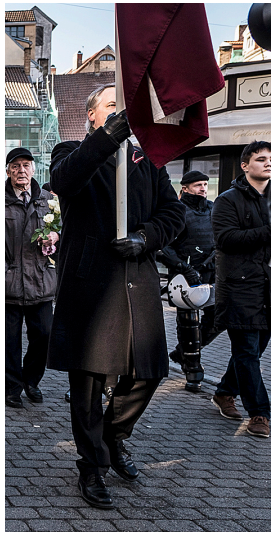
1. Un militant estonià amb un pedaç del Totenkopf nazi al braç. 2. Religiós luterà encapçalant la processó fins al Monument a la Llibertat. 3. Esplanada del Monument a la Llibertat.