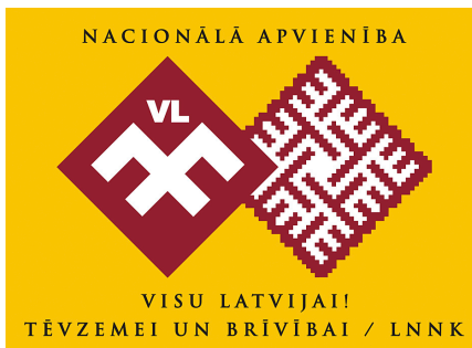
Logotip de l'Aliança Nacional-Tot per Letònia! A l'esquerra, el símbol pagà del cap doble o jumis . A la dreta, un emblema inspirat en la creu del foc, en letó ugunskrusts .