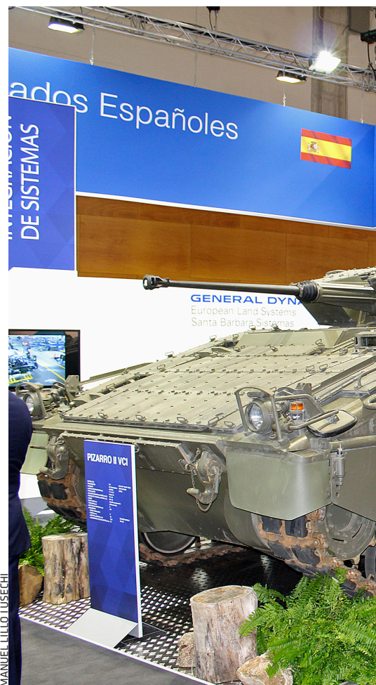
Dalt, un tanc exposat per l'empresa General Dynamics, una de les més potents del sector. A sota, literatura patriòtica a la venda en Homsec, que recorda el passat colonial espanyol.