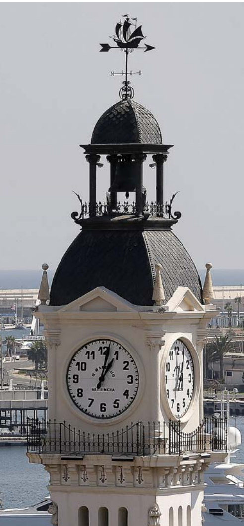
El Veles e Vents, l'edifici més simbòlic de La Marina de València, s'ha reconvergit en un espai gastronòmic, amb tres concessions d'aquest tipus. En primer terme, la Torre del Relloige del port.

va saber la setmana passada a les Corts valencianes, el ministre d'Hisenda, Cristóbal Montoro, va proposar l'any 2013 que l'Estat assumira la seua part del deute i abandonara l'organisme, però Rita Barberà no va voler sentir-ne parlar. Això hauria obligat l'Ajuntament i la Generalitat a retornar fins l'últim euro i a respondre de les quotes impagades, mentre que en la situació actual, en cas d'impagament, el Govern espanyol se'n fa responsable com a avalista.