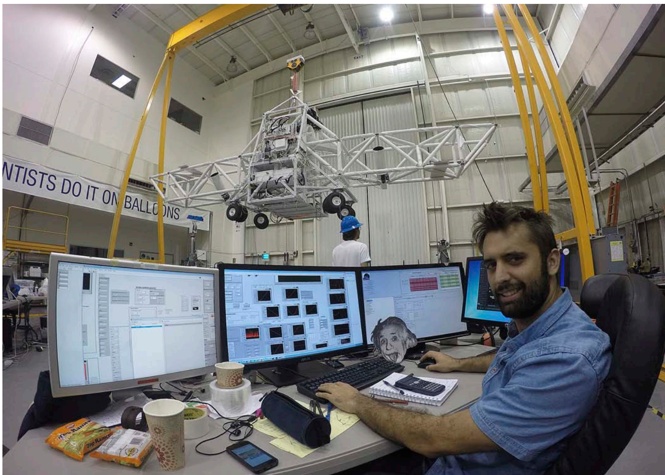
Vila a la sala de treball del seu equip. Al fons, el telescopi BETTII, que estudiarà clústers d'estrelles i que pretén demostrar que un interferòmetre pot funcionar encara que no estigui fix a la Terra. Si és així, es podrien enviar a l'espai i es multiplicaria per molt la resolució dels telescopis que actualment hi ha en òrbita.

fins i tot pots demanar que et comprin material. No et diuen mai que no, i si hi ha una cosa que no saps fer, pots anar provant de connectar això aquí o allà per veure què passa.