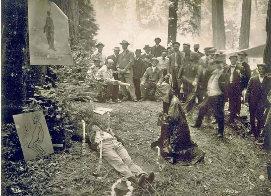
Durant els quinze dies que dura el campament anual d'estiu del secret i selecte club els membres es dediquen a fer, entre altres coses, estranys rituals. En la foto de baix, Ronald Reagan i Richard Nixon en un acte del Bohemian el 1957, imatge que ha servit per assegurar que el secret club fabrica presidents.

un parell de dies, se suposa que per fer una conferència o participar en algun debat] per gaudir de la naturalesa i d'una sèrie d'activitats culturals que inclouen concerts, obres de teatre, recitals i xerrades sobre qüestions d'actualitat".