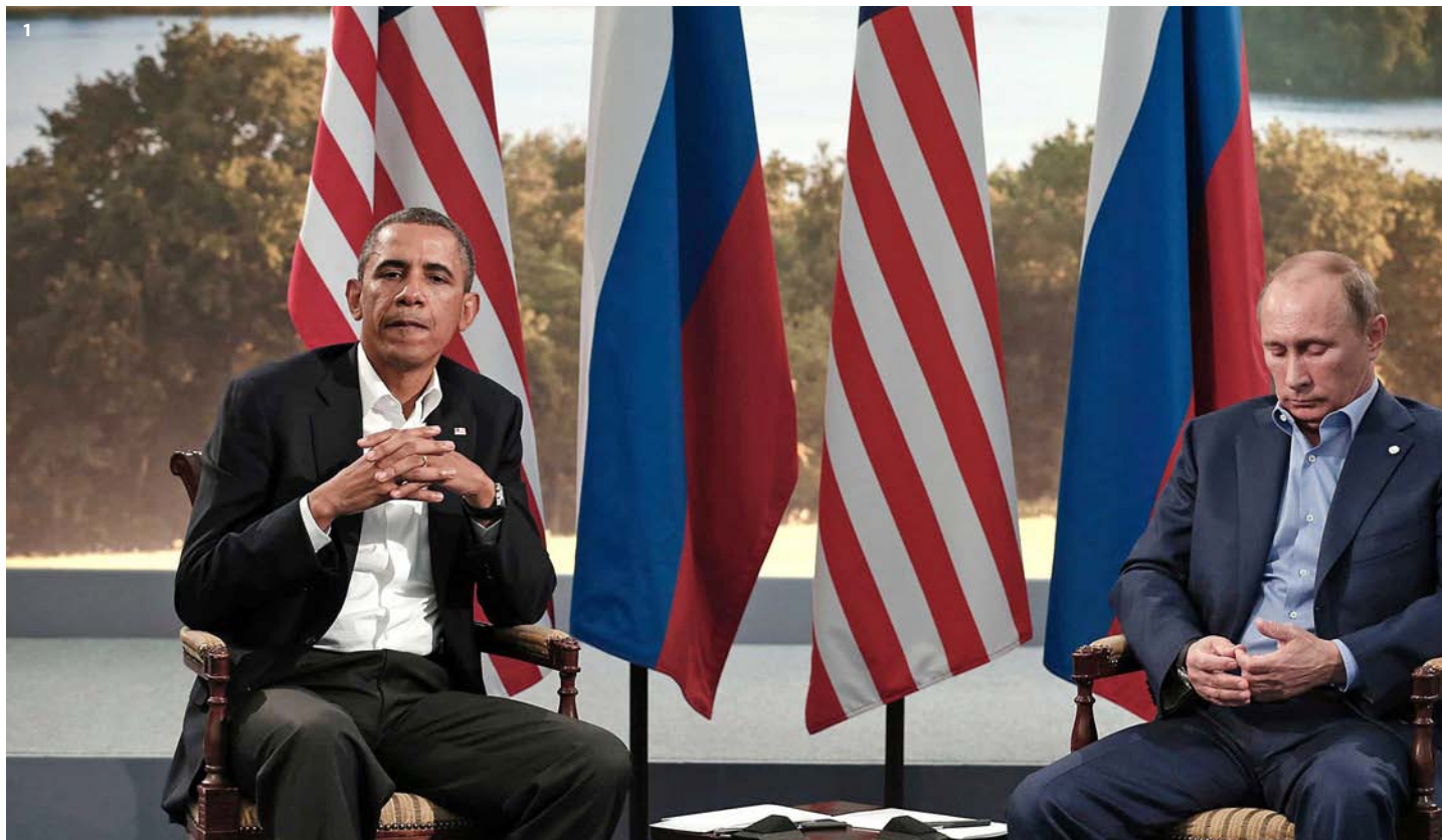
1. De la relació entre Moscou i Washington durant els dos mandats d'Obama s'infereix que Rússia ha vençut els Estats Units a Ucraïna i sobretot a Síria. 2. Obama no ha sabut com relacionar-se amb el competidor econòmic dels Estats Units, la Xina dels dos models: el comunisme i el capitalisme. 3. Les relacions d'Obama i el primer ministre israelià, Benjamín Netanyahu començaren essent tenses i han acabat essent d'allò més dolentes.

→ brutal del nivell de vida, amb una baixada en picat del PIB, amb l'augment de l'atur fins a cotes enormes que deixà uns 40 milions de pobres... Tanmateix, aquella situació dels anys noranta havia mutat força el 2009. Quan Obama prengué possessió del càrrec, Putin havia aconseguit millorar les condicions de vida de molts russos que abans ho havien passat força malament, s'havia creat en el país una classe mitjana més o menys estable i gràcies a les entrades de divises del petroli el Govern havia pogut rentar la cara al sistema, fent-lo més social. Al mateix temps Putin ja controlava tots els ressorts de la seguretat estatal i mantenia sintonia amb les grans empreses del país. En resum, internament era molt més fort que no ho havien estat els seus immediats antecessors”.