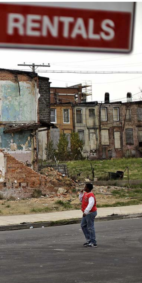
La pobresa ha disminuït als Estats Units durant el mandat d'Obama, però continua havent-hi un fort descontentament social

ria de crear], cosa que despertà moltes reticències a Israel'.