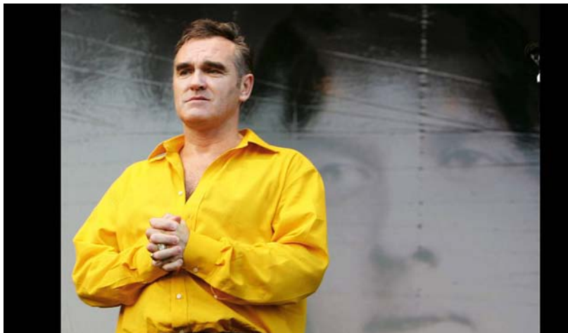
Morrissey, durant la seua actuació al Festival de Benicàssim de 2006. De fons, Oscar Wilde.

→ participaren en la composició, un 10% cadascun. Morrissey dedica pàgines i pàgines, de vegades divertides, quasi sempre reiteratives, a fer-li un vestit al jutge que donà la raó a Joyce. I maltracta sense pietat el “bastonejador de tambors”. Rourke i Marr, per acció o per omissió, també recullen els dards del seu egocèntric company. I sí: malgrat reconèixer en diferents moments que és una persona “difícil de suportar per a molta gent”, Morrissey dibuixa el trencament dels Smiths com quelcom de sobtat i, en certa manera, inexplicable. “Res de disputes d’alt octanatge (...), res de mobiliari volant pels aires”.