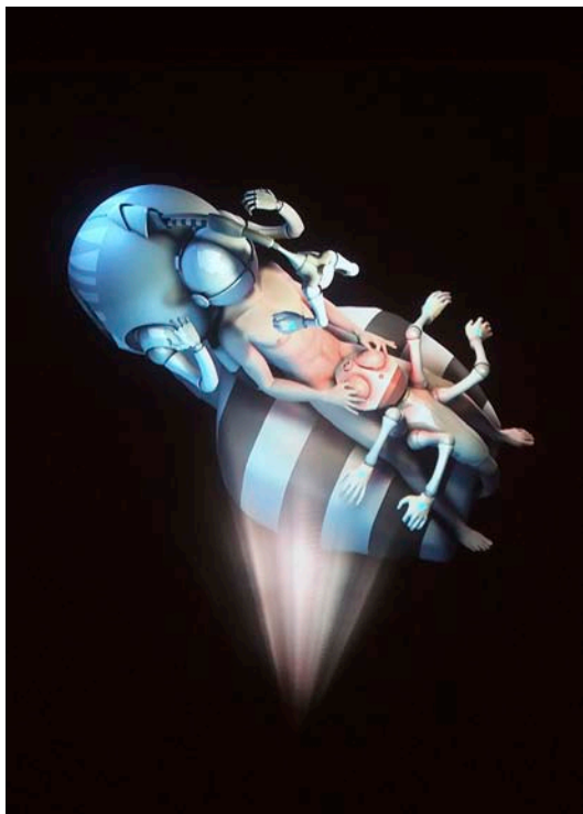
El Nooscaphe-X1 Cybersex Immersion Engine de l'artista Yann Mihn. Prototip d'una màquina d'immersió total en la realitat virtual per a l'estimulació amb joguines sexuals controlades per ordinador.

→ na, relacionada amb la filosofia materialista de l'època, només té un objectiu: celebrar el desig i el gaudi dels cossos. Entrar al gabinet llibertí és entrar en un món imaginari, en què els personatges se sotmeten a totes les fantasies del desig. També és colar-se de la mà del narrador, observador clandestí, en l'atmosfera dels llocs tancats, com ara els tocadors, les cel·les dels convents o els bordells.