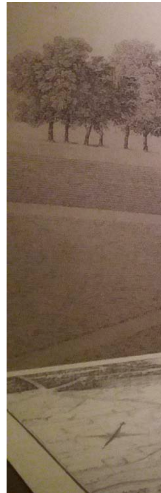
Representació de l'Oikema, el temple del plaer que va projectar l'arquitecte francès Charles Ledoux per a la seva ciutat ideal de la Saline de Chaux.

A l'exposició també es reivindica una relectura del pensador francès Charles Fourier, que va proposar un programa de desenvolupament econòmic i de transformació social basat en el reconeixement i la satisfacció total de les passions individuals: un paradís sexual i de realització personal que va anomenar Harmonia. Aquesta utopia comunitària del plaer, radical i imaginativa, gira al voltant dels falansteris, unes cèdules d'ex-