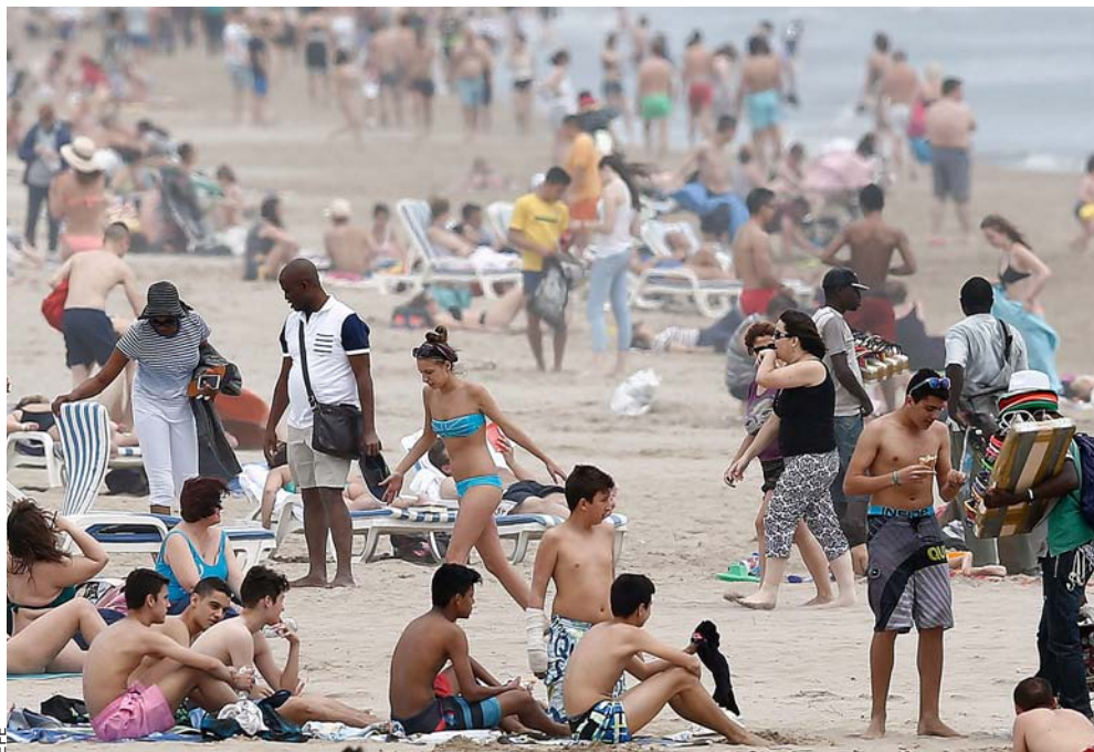
Platja de la Malva-rosa (València).

Pel que fa a la població marroquina –la principal colònia estrangera al conjunt de Catalunya, el País Valencià i les Balears–, també presenta una estabilitat destacable. Del 2010 al 2015, per exemple, la població marroquina de les Illes va mantenir-se pràcticament intacta –22.000 persones–, i al País Valencià, amb petites fluctuacions depenent de la demarcació, la xifra global de persones originàries del Marroc tampoc no va patir cap descens, sinó que va mantenir-se a l'entorn dels 75.000 habitants. Els marroquins tampoc no han abandonat Catalunya: el 2010 n'hi havia 214.000, i cinc anys més tard, el 2015, uns 207.000.