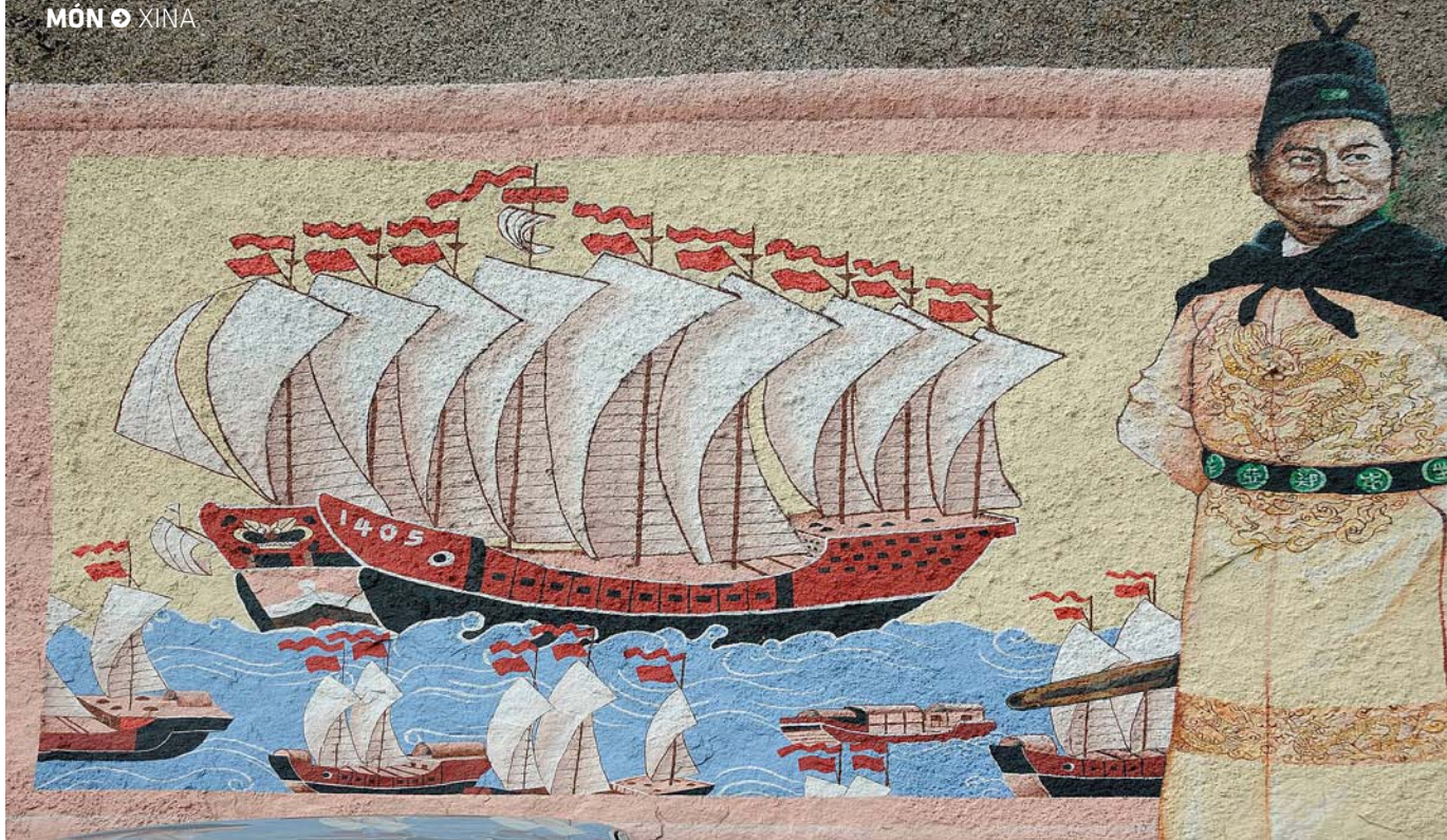
Zheng He va dur a terme travessies de Xina fins a l'altra banda de l'índic el 1405, proposava una Xina pròspera que mirés a l'exterior i tecnològicament avançada, visió que Xi vol recrear.