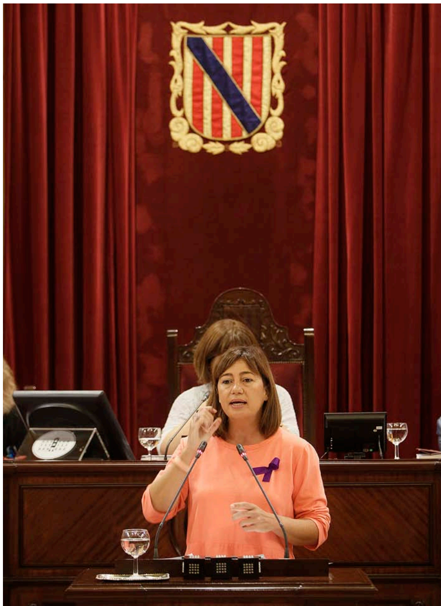
La presidenta Francina Armengol aconsegueix esvair la possibilitat de trencament per part de Podem.