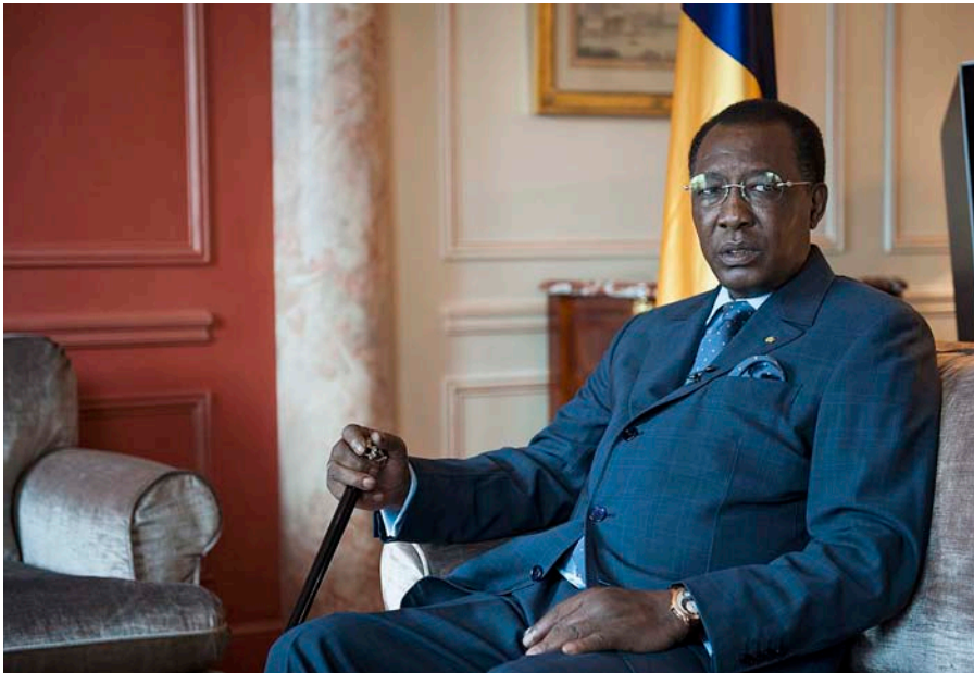
Susanne Koelbl © Der Spiegel

D éby, de 64 anys, és un dels caps d'Estat més influents d'Àfrica. Governava el Txad des de l'any 1990 després de liderar un aixecament contra el president del moment i va ser un aliat del dictador libi Muammar al-Gaddafi. Actualment és el president de la Unió Africana.