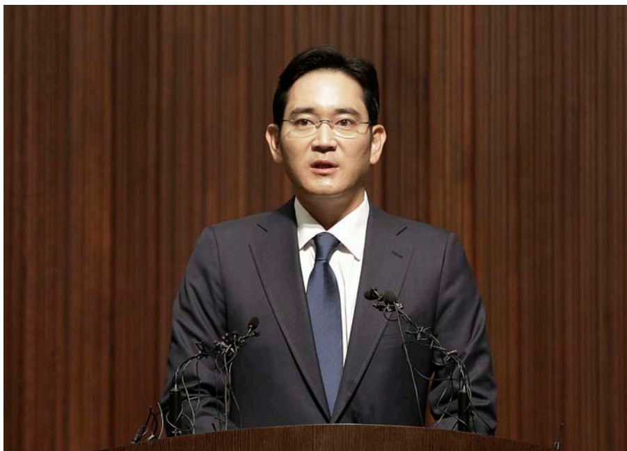
Lee Jay Yong de 48 anys, vice-president de Samsung Electronics.

→ de telèfons mòbils més gran del món. També en el cas de televisors, ordinadors i xips de memòria va iniciar una ofensiva exportadora rere l'altra.