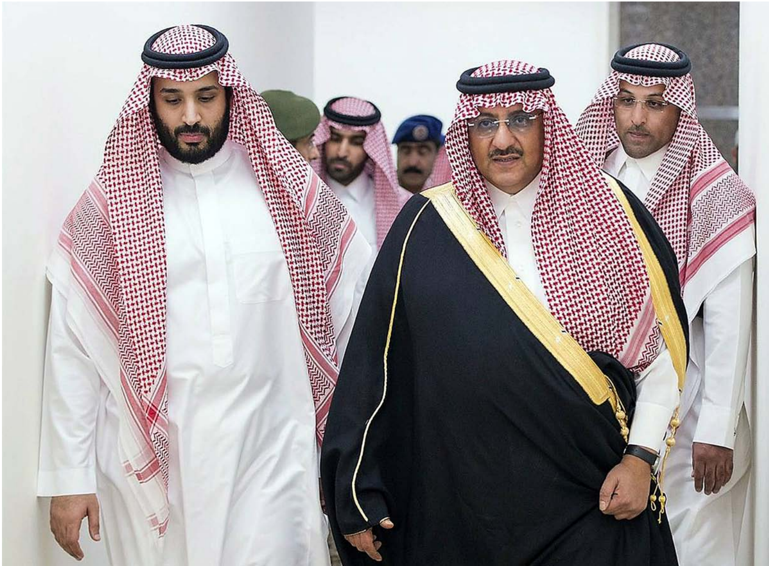
A l'esquerra de la imatge Mohamed I, el fill més jove del rei Salman i ministre de Defensa acompanyat de Mohamed bin Nayef, que és oficialment el successor.