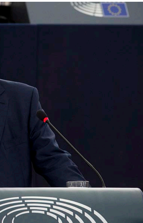
Jean Claude Juncker va prometre "protecció", wifi i ajudes a l'Àfrica, i va evitar el Brexit .

militars de la UE, una proposta franco-alemanya promocionada al discurs de Juncker. També van declarar la importància del control de les fronteres externes de la UE. Però en aspectes més substancials com les normatives d'asil o la integració de l'eurozona, l'acord sembla més esquiú que mai.