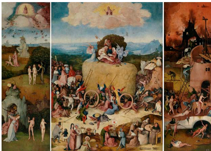
Dalt, una exposició multimèdia dedicada al Bosch a la ciutat de Berlín. A sota, triptic d' El carro de fenc , on aborda la qüestió del desig i la seducció del dimoni.

comptes de petxines, i alguns edificis semblen criatures orgàniques, com si respiressin.