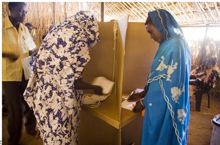
L'abril de 2010 es van celebrar les primeres eleccions democràtiques a Sudan. Un grup de dones voten en el camp de refugiats d'Al Salam, prop d'El Fasher.

Nicholas Cheeseman, un professor de la Universitat d'Oxford, calcula que, dels 91 presidents i primers ministres que han estat en el càrrec al continent en règims civils des del 1989, un 45% o bé abans →