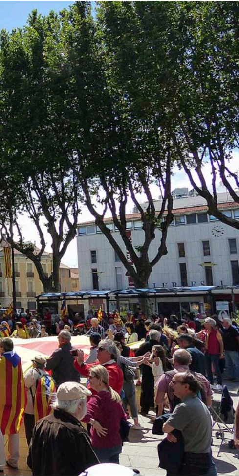
Un miler de persones es van manifestar el 18 de juny a Perpinyà sota el lema "Sí al País Català". Després d'un estiu molt actiu, s'espera que la manifestació del proper 10 de setembre sigui massiva.