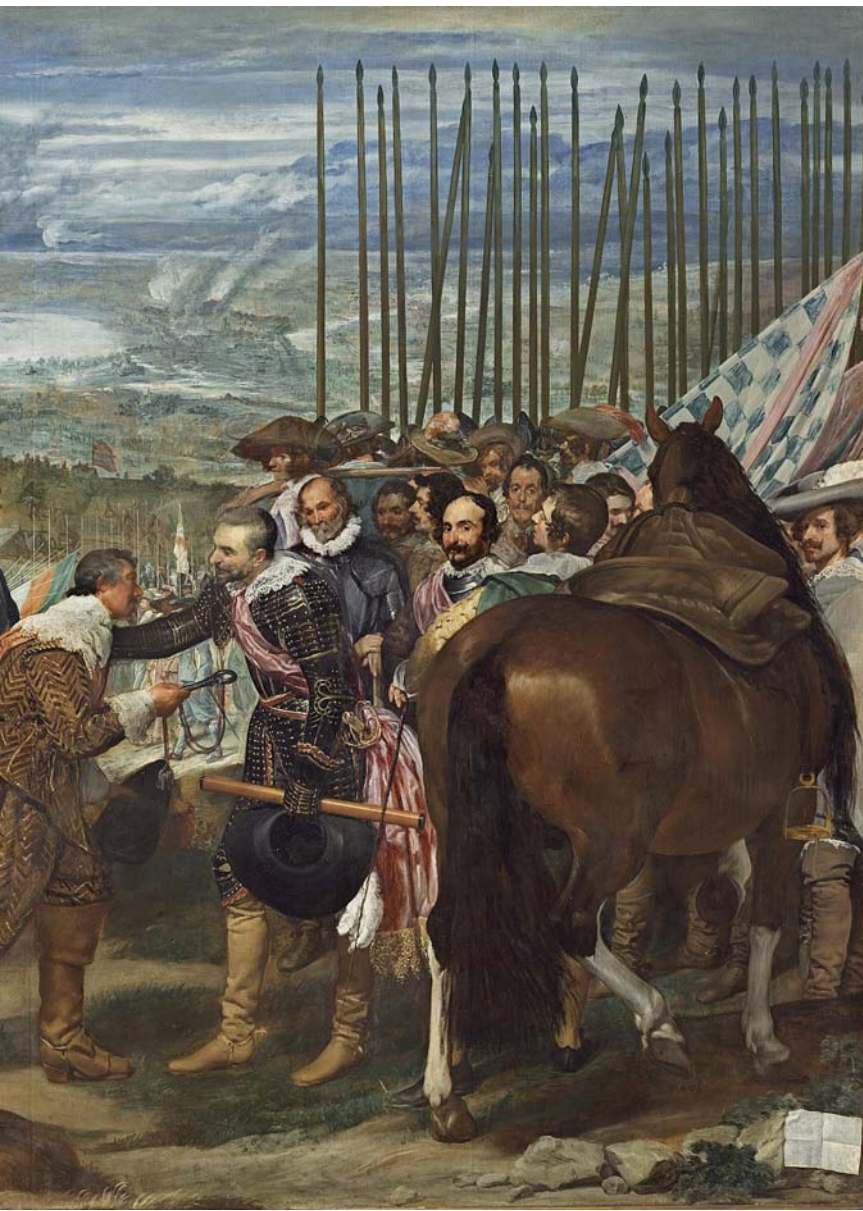
El famós quadre La rendició de Breda , de Diego Velázquez, fresc d'un dels episodis àlgids del tauler polític del convuls segle XVII europeu.

longació del conflicte i la seua intensitat i extensa durada van convertir Europa sencera en un dur laboratori d'aplicació dels principis de la «raó d'Estat», de les estratègies polítiques i militars», explica Cuerda. L'historiador recorda que la Pau de Westfàlia, que posà fi a la guerra, podria considerar-se «el primer congrés diplomàtic modern».