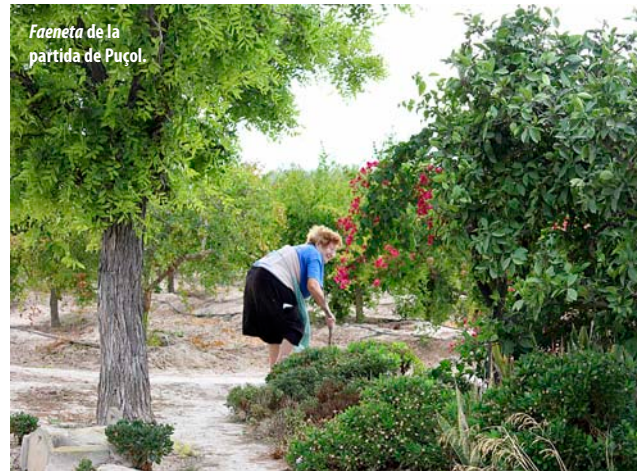
Faeneta de la partida de Puçol.