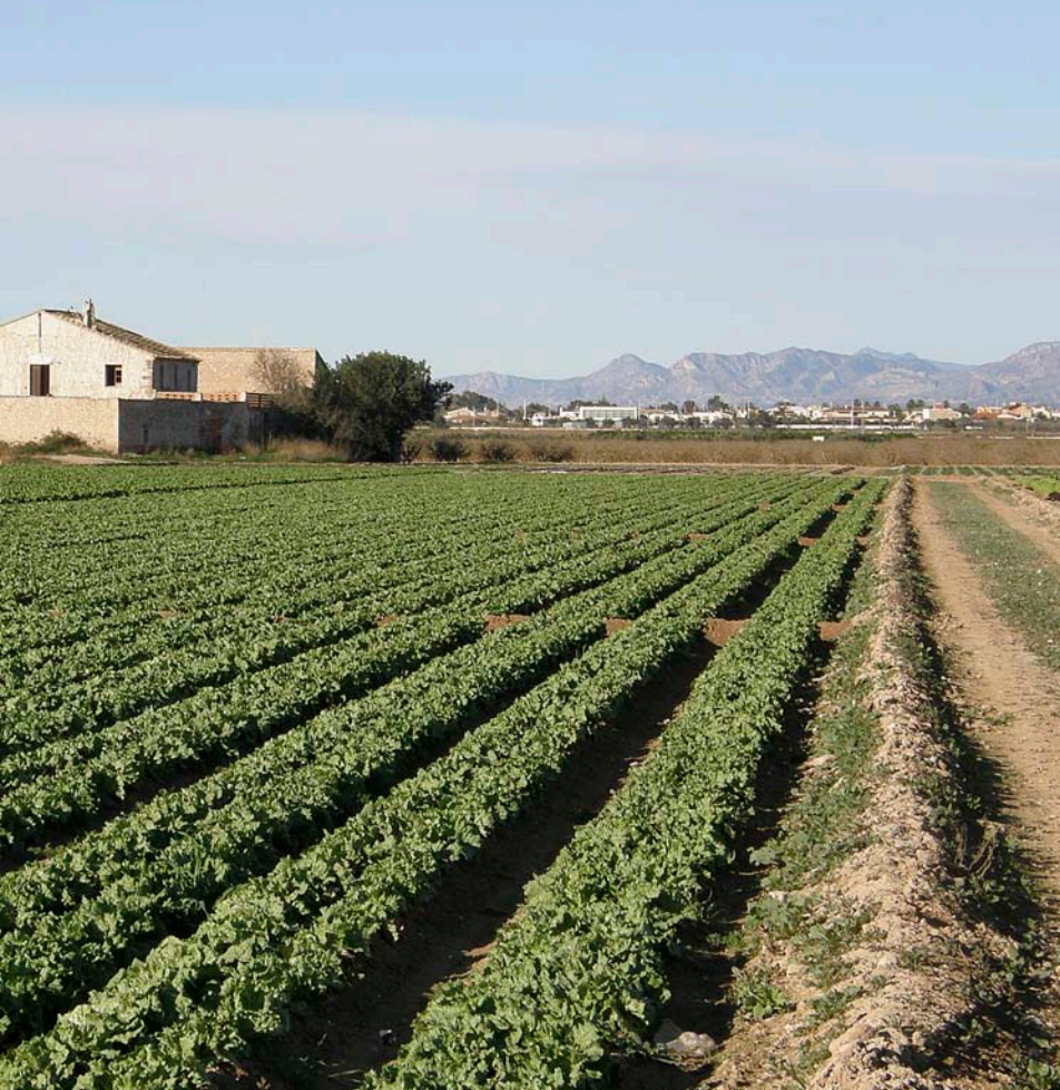
Casa de camp a la partida de Vallverda.