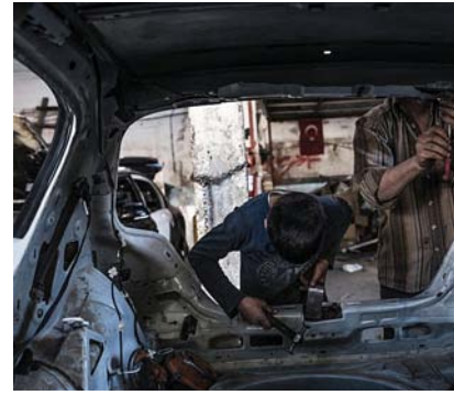
Ahmed treballa en un taller de ferralla. El seu cap li ha promès cinc piastres (un centí i mig d'euro) per cada quilo de ferralla que li porti. A sota, la cancellera alemanya, Angela Merkel, i el primer ministre turc, Ahmet Davutoglu, visiten el camp de refugiats sirians de Gaziantep, a Turquia, el 23 d'abril.