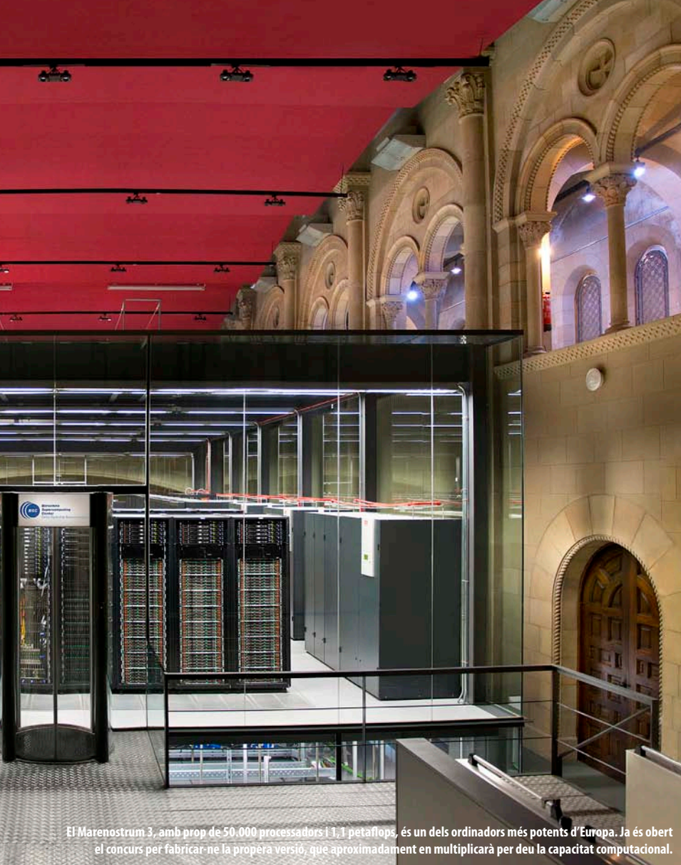
El Marenostrum 3, amb prop de 50.000 processadors i 3,1 petaflops, és un dels ordinadors més potents d'Europa. Ja és obert el concurs per fabricar-ne la propera versió, que aproximadament en multiplicarà per deu la capacitat computacional.