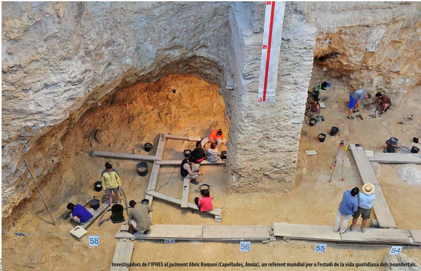
Investigadors de l'IPHES al jaciment Abric Romani (Capellades, Anoia), un referent mundial per a l'estudi de la vida quotidiana dels neandertals.

humans en territoris que per a ells eren nous”.