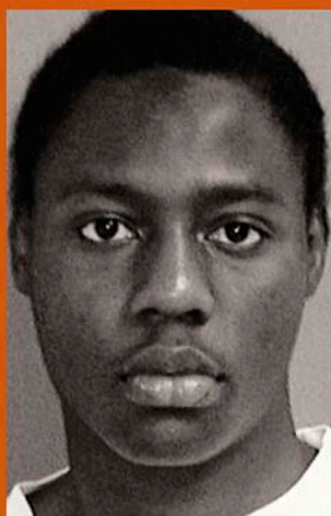
Umar Farouk Abdulmutallab

L'estudi britànic 'Engineers of Jihad' investiga per què hi ha tants jihadistes enginyers i destaca les sorprenents semblances que tenen amb els ultradretans d'Occident.