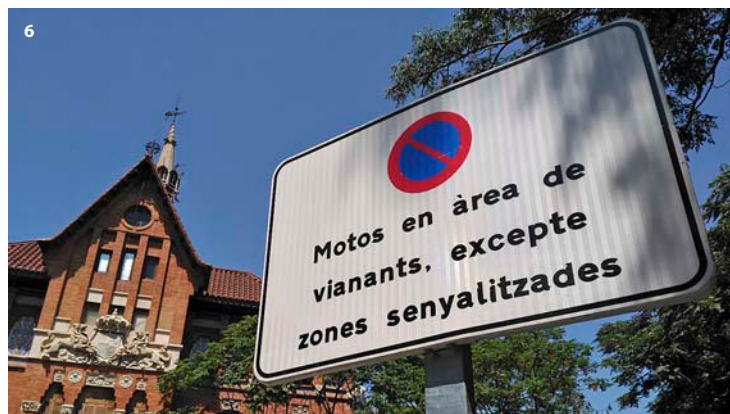
1 i 2. La "zona peatonal" ara és "zona de vianants". 3. Al carrer dels Serrans, el mot bicicletes ha estat tapat per un escut del Reial Madrid que el castellanitza. 4. El carrer dels Manyans, traduït per algun veí. 5 i 6. A l'entorn del Mercat Central, senyals en castellà que no causen accidents i d'altres en català que són un risc.

Unida] es comunicàvem en valencià fins que arribava l'alcalde. Llavors tots ells passaven al castellà, però jo no ho feia".