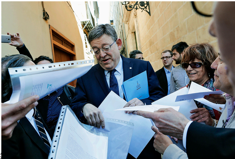
ASSETJAMENT ESCOLAR. Representants de centres concertats van envoltar el president Puig i la vice-presidenta Oltra quan caminaven cap a les Corts per assistir a la sessió de control del 12 de maig.

→ L'altre fet que ha indignat els propietaris dels centres concertats és la decisió del conseller, Vicent Marzà, de prohibir-los cobrar cap quantitat als pares dels alumnes, com feien a través de fundacions religioses o per conceptes que no tenien a veure amb l'ensenyament obligatori. Això significava uns ingressos extraordinaris que ara els pares no es veuran forçats a abonar, perquè l'educació privada concertada presta un servei que abona la Generalitat i que eximeix les famílies d'abonar diners.