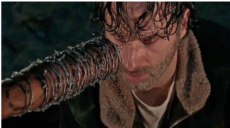
La Lucille apunta al Rick, destrossat per la pèrdua del control.