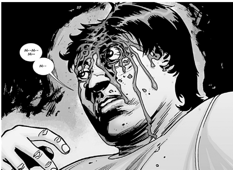
Als còmics, el cap de turc va ser Glenn, però això no vol dir que hagi de ser-ho a la televisió.

→ així, tant l'Eugene com el Glenn, a les puntes, estarien salvats.