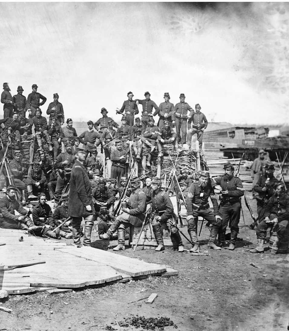
GUERRA DE LA UNIÓ. Es calcula que uns dos-cents mil soldats d'origen alemany van lluitar per la Unió.

societat humana pot arribar a ser feliç i mitjanament ordenada en un país on el poder del govern és tan limitat i no hi domina el respecte profund per les autoritats competents". Schurz va contraatacar amb una lliçó sobre llibertat, defensant "que el poble americà no s'hauria convertit en un poble tan ple de confiança, energia i progrés si al costat de cada xipoll hi hagués hagut un consell secret o un guàrdia per evitar que la gent hi fiqués els peus". Aquest comentari va provocar el riure afectuós de Bismarck.