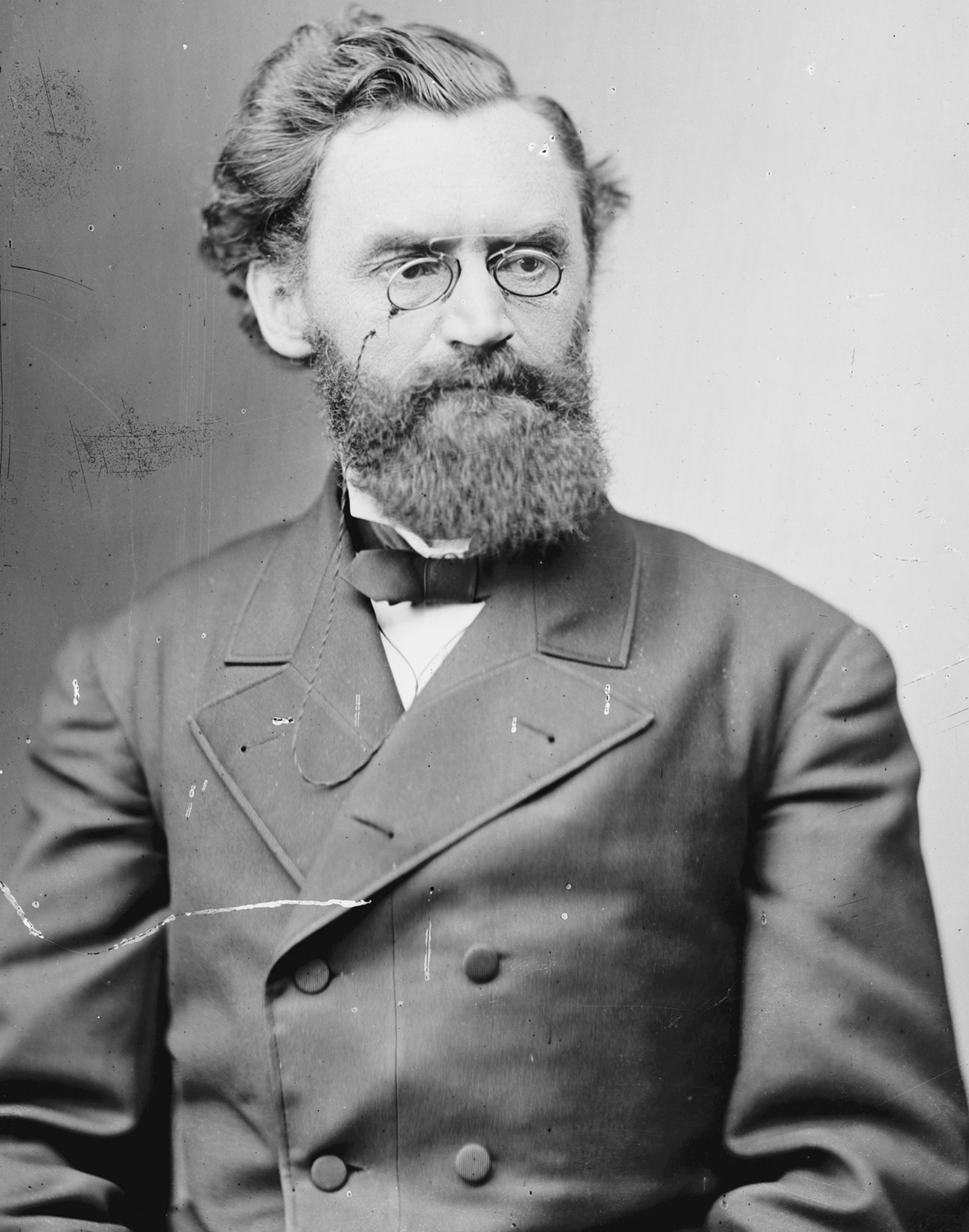
Carl Schurz, 1877