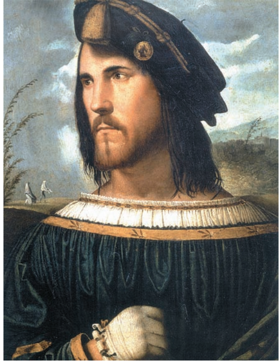
Retrats de Lucrècia Borja i Cèsar Borja, els fills d'Alexandre VI que protagonitzen molts dels documents del Diplomatari 5 .