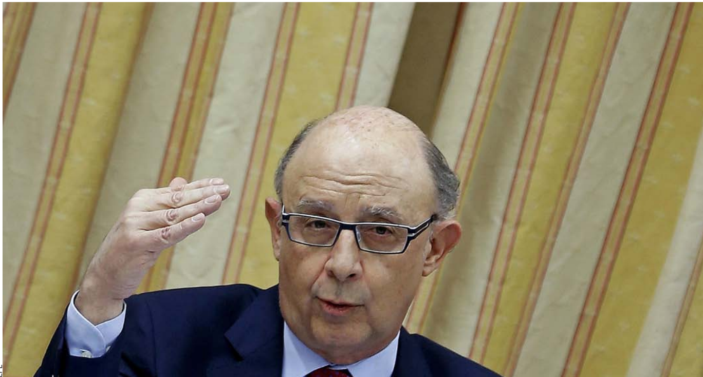
Cristóbal Montoro va comparèixer dijous passat a la Comissió d'Hisenda del Congrés dels Diputats.