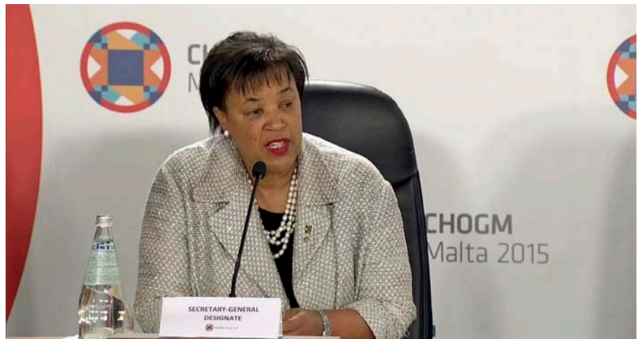
Patricia Scotland, secretària general de la Commonwealth.

Va ser el 1991, a Harare, la capital de Zimbàbue, quan els caps de Govern van declarar que la Commonwealth havi- en de promoure els drets humans i la democràcia. L’organització va guanyar respecte pels equips que enviava d’observadors electorals. El 1995 es va crear un grup d’acció ministerial per tractar →