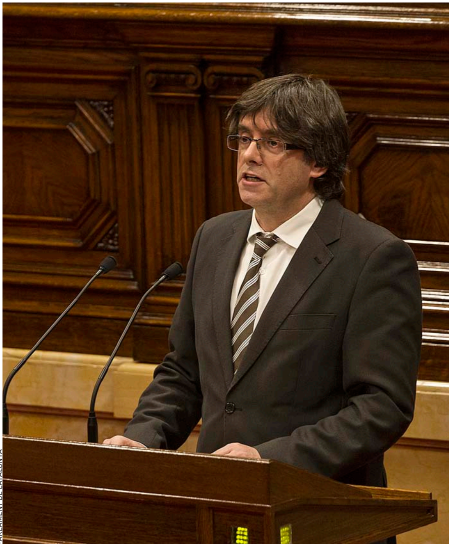
PARLAMENT DE CATALUNYA

L'ENCANT SOCIALISTA. Carles Puigdemont confessa a Em dic Carles : “El 1977 jo era clarament del Pacte Democràtic per Catalunya, que per a mi era la coalició ideal (...). Però el 1980 també m'agradaven coses que deia el PSC; m'interessaven”.