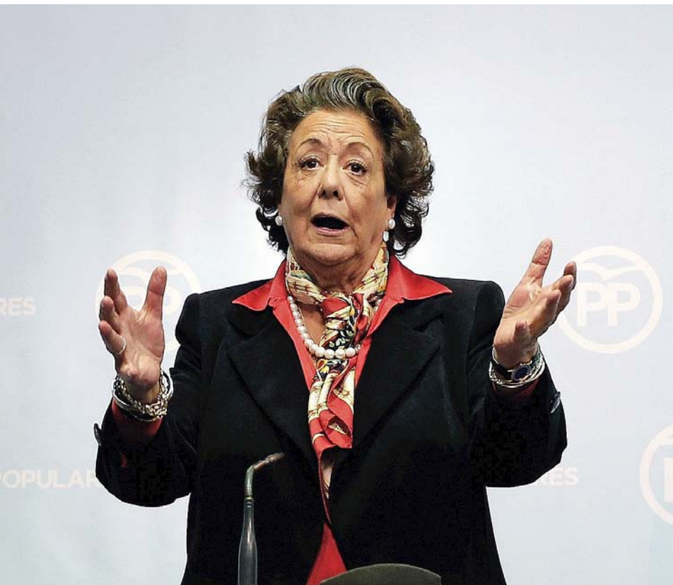
DEL 2009 AL 2016. Francisco Camps i Rita Barberà, a les seues compareixences després que es coneguera la seua implicació en el cas Gürtel i l'obertura de sumari del cas Taula referent a una presumpta neteja de capital.

a campanya com a conseqüència del seu processament pel cas Nóos , que va obligar-lo a dimitir com a vice-alcalde de València i a renunciar a les seues responsabilitats orgàniques el 16 de març del 2015, poc abans que es feren efectius els pagaments en qüestió. És a dir, que Grau coneixia les interioritats del partit fil per randa, i va poder ser ell qui actuara així com a venjança.