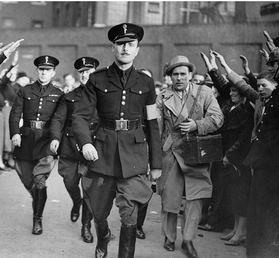
Oswald Mosley en una desfilada de la seva Unió Britànica de Feixistes, uniformat a l'estil militar, tal com feien els feixistes italians i els nazis alemanys.