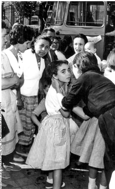
ARCHIVO GENERAL DE LA ADMINISTRACIÓN