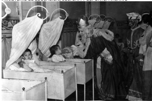
MINISTERIO DE EDUCACIÓN, CULTURA Y DEPORTE. ARCHIVO