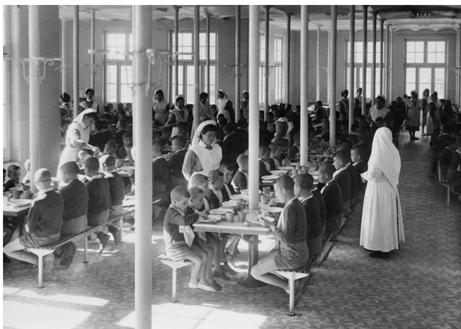
ELS INTERNATS DE LA POR. Els nens i les nenes eren internats en les institucions regides per l'Església des de ben menuts. En alguns casos (fotografia de dalt, corresponent a la Casa de la Maternitat de Barcelona), n'hi havia que s'hi estaven fins la joventut. Sobre aquestes ratlles, el Preventori de la Savinosa, a Tarragona. La norma del centre era que els interns s'acabaren tot el menjar, de pèssima qualitat. Si perbocaven, se'ls obligava a menjar-se el vòmit.

estricta obediència! Recordad que habéis llegado abandonados de todo y algunos en condición de maleantes, mendicantes y viciosos”.