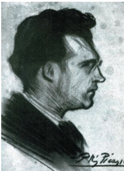
El 1900, Busquets i Punset guanya un premi als Jocs Florals. El premi consisteix en un retrat de Pablo Ruiz Picasso.

Busquets i Punset deixaria l'Hospitalet de Llobregat l'estiu de l'any 1908. Tot i haver-s'hi estat només dos cursos, la ciutat, en reconeixement a la tasca docent i cultural que hi va dur a