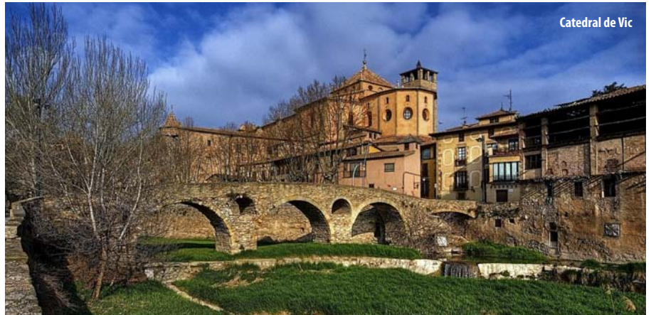
Catedral de Vic

Escriure: (...) encara que sento la delectació de la literatura, mai he conreat les lletres per les lletres; sempre hi sóc cercant un fi pràctic; sempre han sigut la Fe i la Pàtria les que m'han posat la ploma als dits. En Rocabertí i en Bossuet.