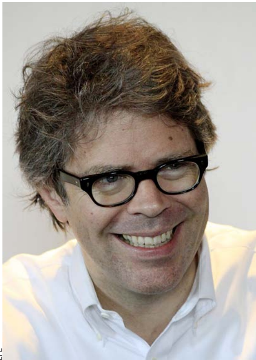
CONTROVERTIT. L'escriptor d'Illinois Jonathan Franzen, un dels novel·listes que més debat i passions confrontades genera en aquest inici del segle XXI. L'aparició de Purity ha tornat a revifar la controvèrsia. En la fotografia, Franzen, l'any 2013.

E n essència, la dialèctica al voltant del voltatge literari de Jonathan Franzen (Western Springs, Illinois, 1959), de la seua autèntica mida, té a veure amb la suada controvèrsia que generen els personatges de la cultura amb predicament crític i vendes de best-seller dignes del mainstream literari. Aquesta confluència pot generar, d'una banda, hiperbòlics corrents d'adhesió com el que va fer que la revista Time posara Franzen en la seua cobdiciada portada amb la grandiloqüent consideració de "gran novel·lista americà".