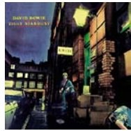
The rise and fall of Ziggy 1972

Space Oddity (1969) i The man who sold the world (1970) eren ja un toc d'atenció sobre l'immens talent de Bowie. Però Hunky Dory és la irrefutable confirmació. "Changes" o l'imperial "Life on Mars?" són les immortals cimeres del disc.