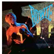
Let's dance 1983