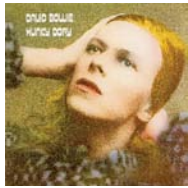
Hunky Dory 1971

Space Oddity (1969) i The man who sold the world (1970) eren ja un toc d'atenció sobre l'immens talent de Bowie. Però Hunky Dory és la irrefutable confirmació. "Changes" o l'imperial "Life on Mars?" són les immortals cimeres del disc.