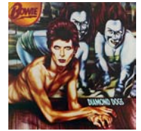
Diamond dogs 1974

Amb Aladdin Sane Bowie rebaixa la grandiloquència, augmenta l'electricitat i cerca un discurs que bascula amb naturalitat entre la disbauxa i l'elegància. El tema titular, un viatge de la subtilitat a la instrumentació desbocada, simbolitza el concepte.