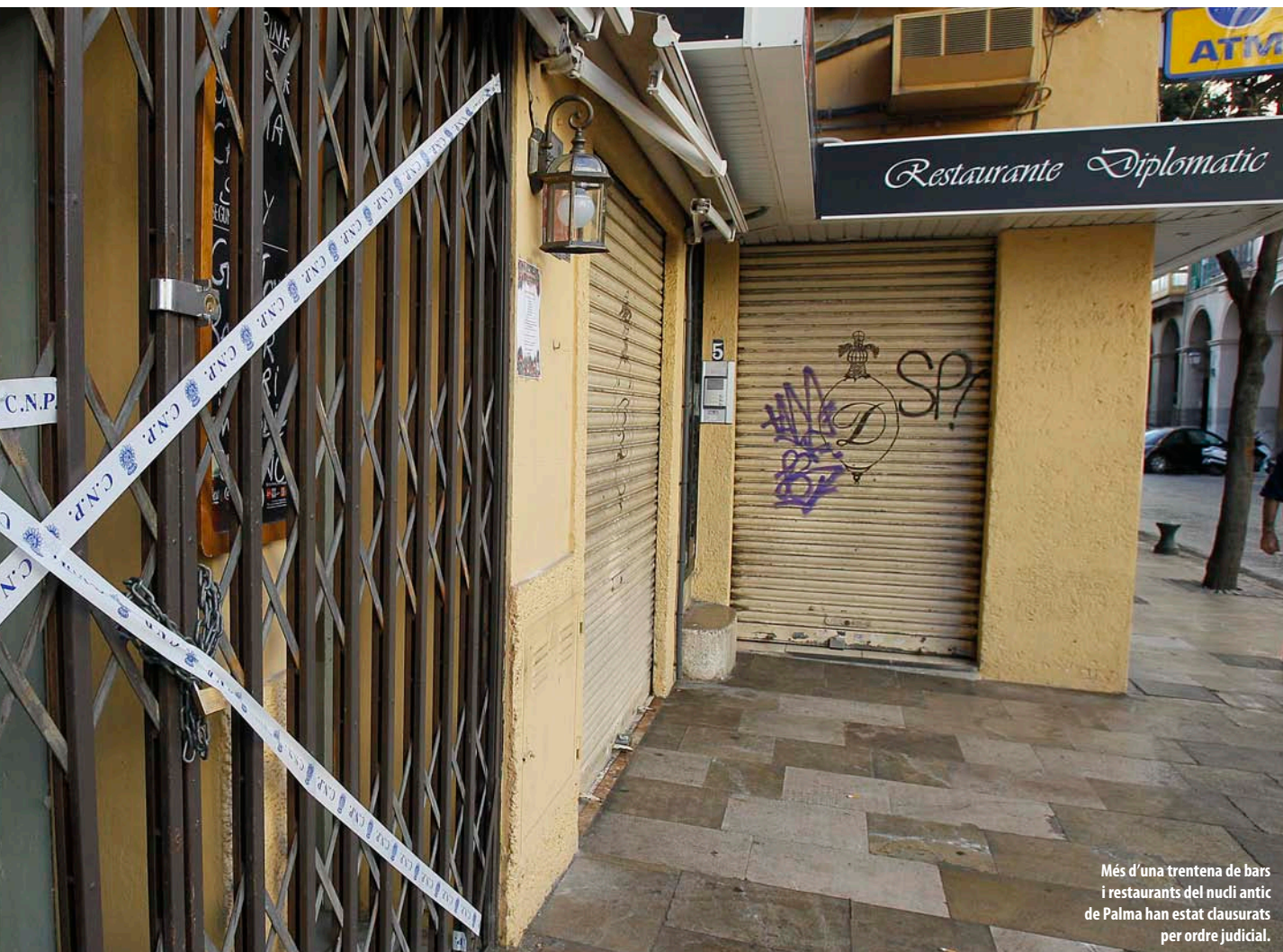
Més d'una trentena de bars i restaurants del nucli antic de Palma han estat clausurats per ordre judicial.