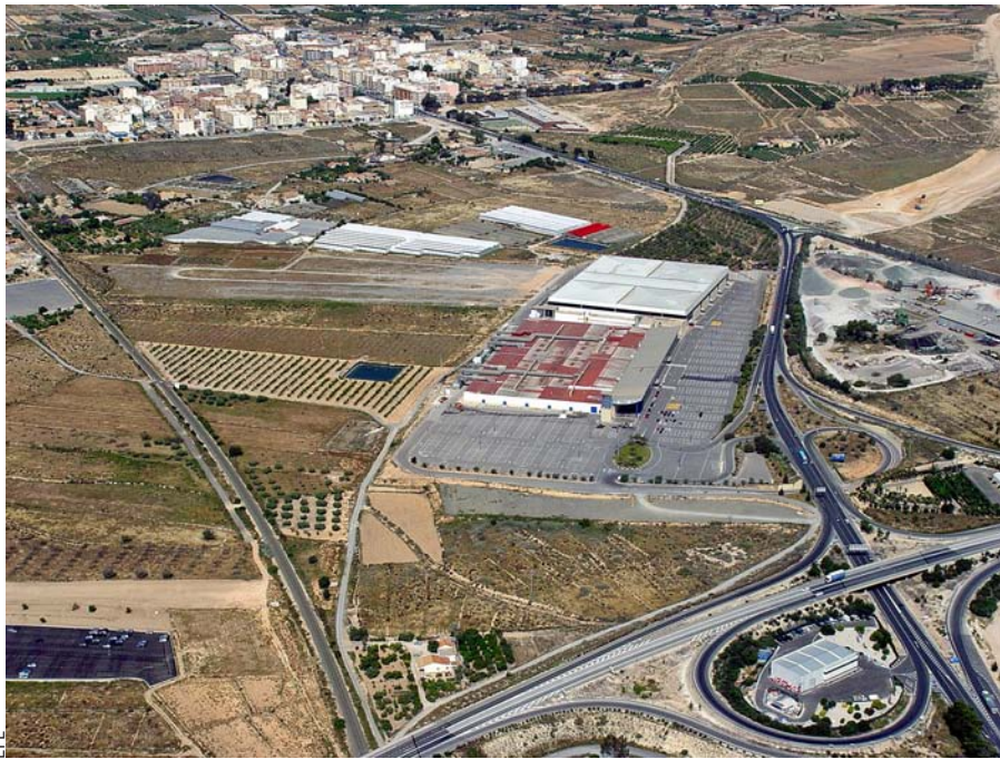
LA FIRA I EL PORT. La Institució Firal Alacatina (IFA) se situa tot just a la carretera que uneix Elx amb Alacant, més a prop de la primera ciutat que no de la segona. Al seu torn, el port d'Alacant es troba a l'eixida de la ciutat cap a Elx.