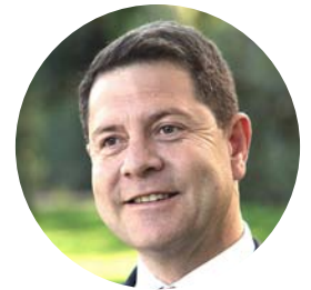
EMILIANO GARCÍA-PAGE CASTELLA-LA MANXA