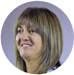
IDOIA MENDIA PAÍS BASC