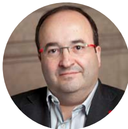
MIQUEL ICETA CATALUNYA