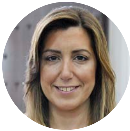
SUSANA DÍAZ ANDALUSIA