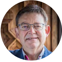
XIMO PUIG PAÍS VALENCIÀ