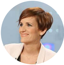
MARÍA CHIVITE NAVARRA