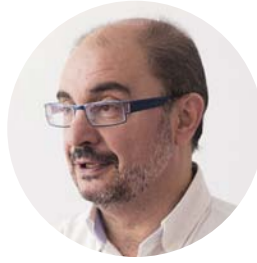
JAVIER LAMBÁN ARAGÓ