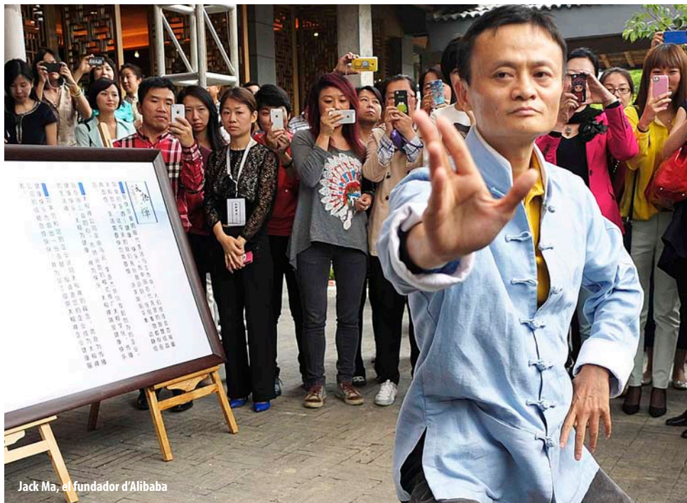
Jack Ma, el fundador d'Alibaba

"L'economia xinesa viu el començament d'un alentiment permanent. Per mitigar-ne els efectes adversos, el Govern xinès ha de canviar les antigues maneres de funcionar", segons diu una avaluació anual de l'economia feta per la Cambra de Comerç de la Unió Europea a la Xina, publicada després de la recent sacsejada als mercats de valors i de divises. La taxa de creixement del país ha baixat de les desenes a prop d'un 7% (segons les dades oficials) i el nivell de deute respecte al PIB s'ha enfilat. La malapta devaluació que va fer la Xina