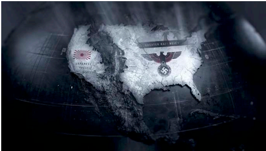
EL MÓN NAZI. En cas de victòria de les potències de l'eix, Estat Units haurien quedat sota control japonès i alemany segons fantasiaja el llibre de The Man in the High Castle .