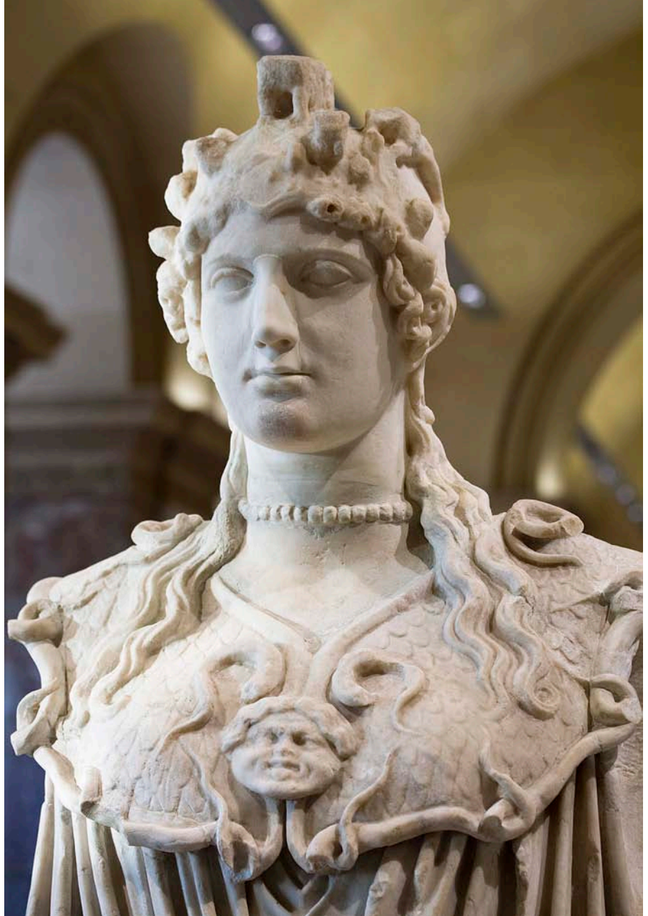
Les característiques simbòliques de la figura de la Mare de Déu. Verge és simplement una mala traducció de l'hebreu; el concepte té sentit en grec (la deessa Atena, a la imatge, era parthenos , 'verge') però no per al poble d'Israel.

En una societat clarament masclista, afirmar que un déu necessita una mare per tal de ser plenament déu no deixa d'enviar un missatge positiu per a moltes dones oprimides. La teologia feminista ha explotat aquesta intuïció d'una manera molt intensa. La virginitat de Maria seria, per a elles, bàsicament una forma