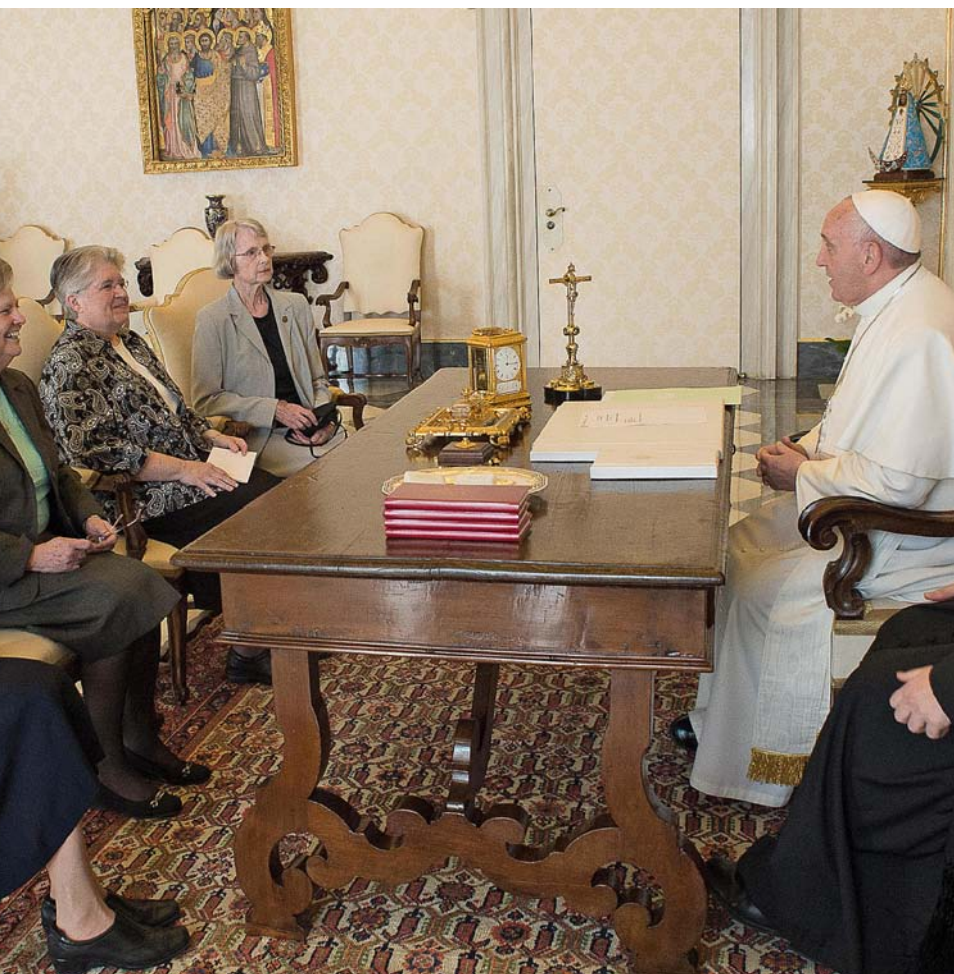
INSTITUCIÓ ECLESIASTICA. A l'esquerra, les religioses progressistes de la LCWR, de manifestació. A la dreta, el papa Francesc es reuneix amb representants de la Conferència de Lideratge de Dones Religioses dels EUA en la seva biblioteca al Palau Apostòlic del Vaticà el 16 d'abril. Baix, el bisbe opusdeista de Kansas Robert Finn que va dimitir per temes de pedofília.