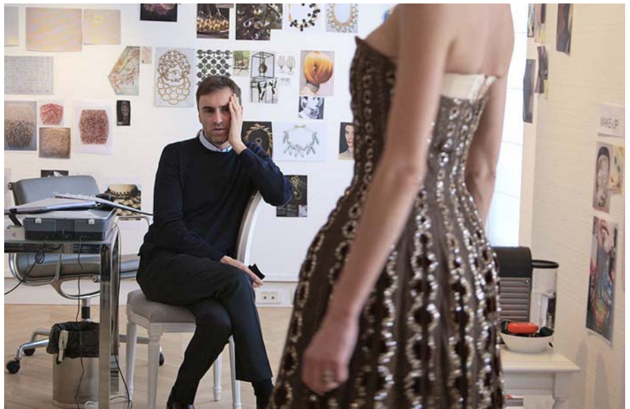
Un dels fotogrames de Dior et moi , amb Raf Simons supervisant amb una model un dels vestits de la seua primera col·lecció en Christian Dior.

La càrrega de treball, les estretors temporals a l'hora de fer les col·leccions, la pressió. "Quan fas sis desfilades a l'any no tens temps suficient per a tot el procés. Tècnicament, sí, però no tens temps per incubar les idees", deia per a la revista System . A Simons, aquest ritme embogit el frustrava. El cansava. Alguns apunten