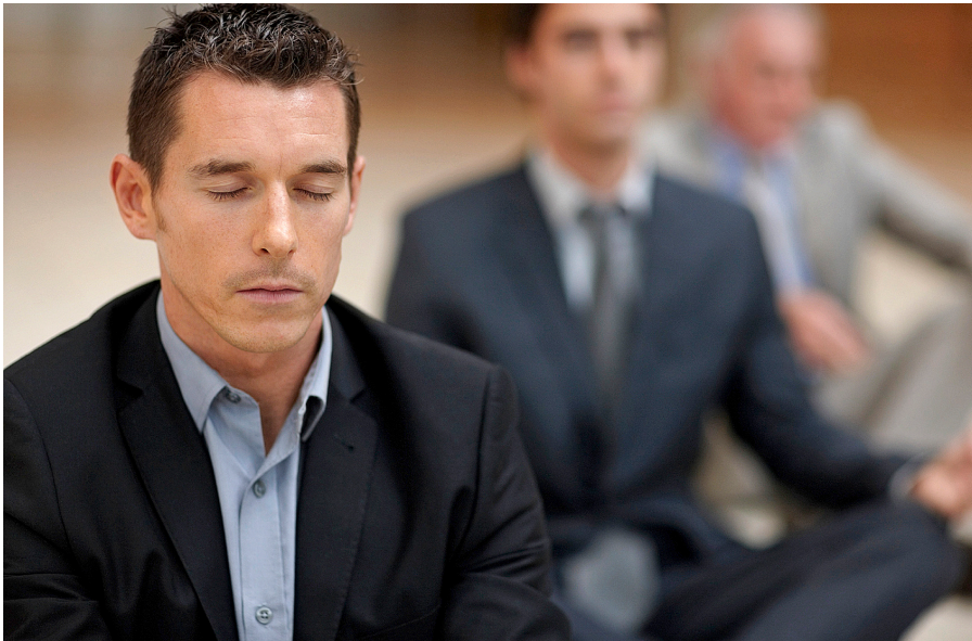
La incorporació del mindfulness al món de l'empresa ha despertat suspicàcies

→ tra que la pràctica d'aquestes tècniques genera beneficis neurològics, fisiològics i psicològics". "L'atenció plena pot ser útil a qualsevol: ho és per a una persona en tractament psicològic, perquè pot ser una teràpia complementària a la intervenció estàndard; però també ho és per a persones sanes que pateixen estrès en el seu dia a dia", assegura el professor Cebolla. I recalca, per als escèptics: "No es tracta d'anar tot el dia abstret i com en un núvol. No. Del que es tracta és de tenir consciència d'un mateix i del que sentim en cada moment i assumir-ho sense jutjar-ho".